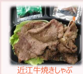
近江牛焼きしゃぶ